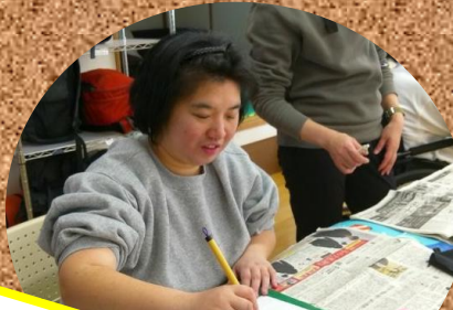
ステップワゴンとドライバーさんへの思いを書きました!