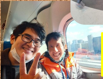
ヘルパーさんと新幹線で広島に行きました