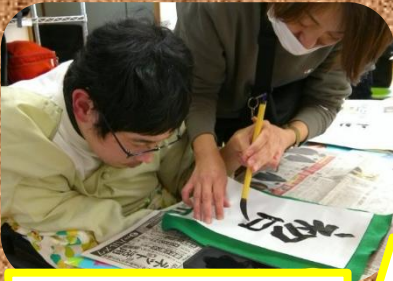
はつひの出と書きました