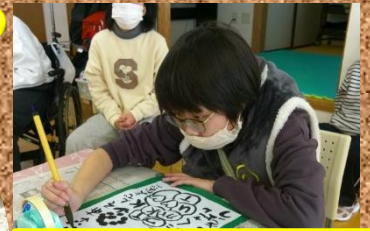
太陽Kさんへの思いと目標を書きました!