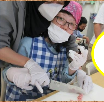
スタッフと一緒に美味しいおやつを作りました!