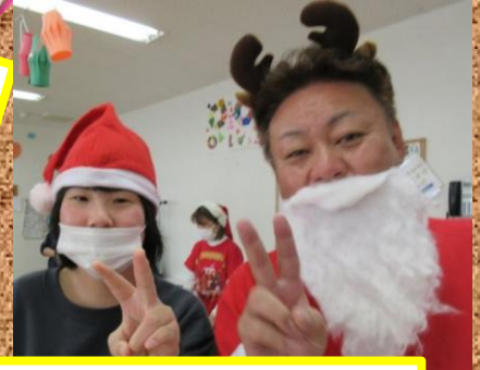
音楽の時間にサンタがきてプレゼントをもらいました!